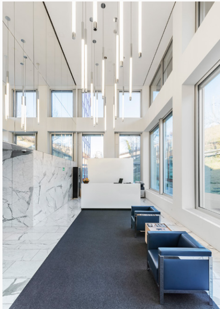
Das Löwenbräu-Areal bietet neben Büros und Wohnungen auch eine Vielzahl von Räumlichkeiten für Ateliers und Galerien.